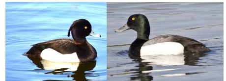
【左：キンクロハジロ♂ 右：スズガモ♂】 サイズや配色がとてもよく似ていますが、キンクロハジロの後頭部のピョンとでた冠羽が見分けるポイントになります。

学校の方はあと2週間で卒業式、約3週間で修了式となり、それぞれの学年が卒業・進級を迎えます。本当にラストスパートです。