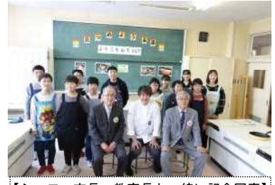
【シェフ・市長・教育長と一緒に記念写真】