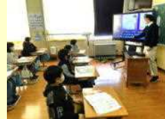
【5年：Who is your hero!】

4年：総合「10才をむかえて」は発表会形式の授業でしたが、お子さんの発表の様子はいかがだったのでしょうか。また、1年：道徳「みんながつかうものだから」では約束やきまりについて考えました。5年：外国語「Who is your hero?」ではALTのケイデン先生がPWを使ってクイズ形式で質問して子どもたちがヒーローを当てる中で、英語の受け答えを学習していました。6年：体育「ドッチビー」では親子対決で盛り上がっていました。必死に逃げて衝突していた親御さんもいましたが大丈夫だったのでしょうか。全体会では今年度で退会なさるPTA役員の方の表彰がありました。長年にお疲れ様でした。そしてこれまでのご協力、ありがとうございました。