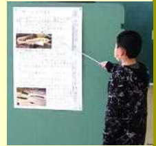
【3年：発見！男鹿市のキラリ】

今年度最後の授業参観がありました。お子さんがお休みの世帯を除けば出席率は98%でした。多数のご参加どうもありがとうございます。2年：生活科「大きくなったよ発表会」、3年：総合「発見！男鹿市のキラリ」、