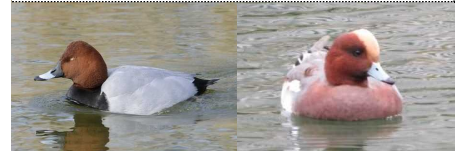
【左：ホシハジロ♂ 右：ヒドリガモ♂】 サイズや配色が似ていますが、ヒドリガモのおでこの白っぽい羽毛が見分けるポイントになります。