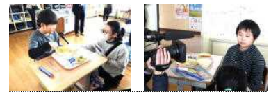
【インタビューに答える児童】